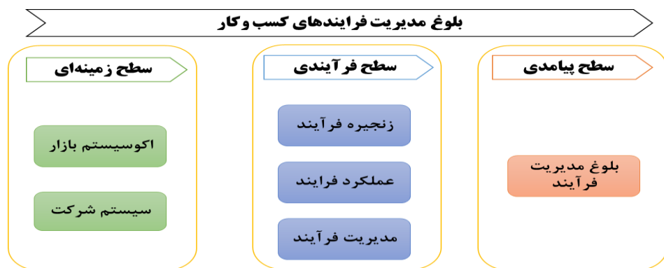
شکل ۲. چارچوب مفهومی عوامل بلوغ مدیریت فرآیندهای کسب و کار در شرکت‌های تولیدی ورزشی

ارتباط و جهت اثرگذاری عوامل فوق در قالب یک مدل مفهومی به صورت شکل زیر ترسیم گردید. جهت اثرگذاری بین عوامل و برآیند تعامل بین متغیرهای به صورت فلش‌های زیر مشخص شده است. ترسیم مدل نشان داد که عوامل زمینه‌ای اساس و پایه عوامل دیگر هستند و در الگوی بلوغ مدیریت فرآیندهای کسب و کار