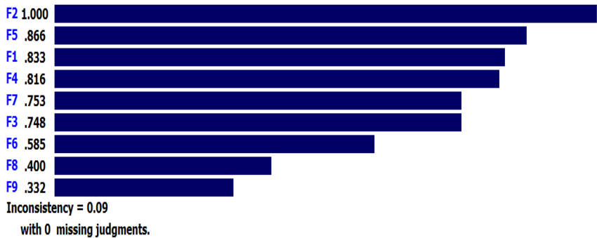
نمودار ۲. وزن مطلق شاخص‌های فساد مالی در سازمان‌های ورزشی کشور

مقایسات زوجی در فرآیند تحلیل، نرخ ناسازگاری محاسبه باید شود. این نرخ برای بررسی اعتبار نتایج کاربرد دارد. در یک مقایسه زوجی چنانچه نرخ ناسازگاری ماتریس مقایسات کمتر یا مساوی ۰,۱ باشد، نتیجه گرفته می‌شود که نتایج از اعتبار کافی برخوردار است. نرخ ناسازگاری در این مقایسه برابر با ۰/۰۹ است بنابراین، سازگاری عوامل قابل قبول می‌باشد. در نهایت عمل تلفیق صورت گرفته که نتایج در نمودار ۲ ارائه گردیده است.