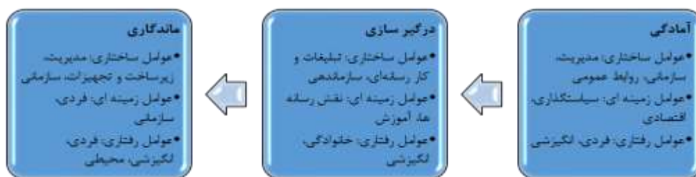
شکل ۲. مدل کلی حاصل از ترکیب دو مدل PEP و سه شاخگی Figure 2. Overall model resulting from the combination of two PEP and three-branch models

همان‌طور که در جدول ۳ مشخص است، بسیاری از کدهای استخراج شده در دو یا حتی هر سه مرحله از مدل PEP با همدیگر همپوشانی دارند و به عنوان عاملی تاثیرگذار شناسایی شده‌اند. در گام بعدی طبق مراحل سه‌گانه مدل PEP و سه شاخگی، ابتدا عوامل ساختاری، زمینه‌ای و رفتاری اثرگذار در هر مرحله در قالب شبکه مضامین ارائه شده است و پس از آن مدل کلی حاصل از ترکیب دو مدل استخراج شد. اولین مرحله از مدل داوطلبی PEP آمادگی می‌باشد. این مرحله برای شناسایی و به کارگیری داوطلبان از اهمیت ویژه‌ای برخوردار می‌باشد. در این بخش عوامل ساختاری، زمینه‌ای و رفتاری اثرگذار در مرحله آمادگی در قالب شبکه مضامین ارائه شده است. پس از ارائه مراحل مختلف مدل و عوامل اثرگذار در هر مرحله، مدل کلی حاصل از ترکیب دو مدل PEP و سه شاخگی استخراج شد. در این مدل مراحل سه‌گانه مدل PEP و مضامین اصلی اثرگذار در هر مرحله از مدل سه شاخگی ارائه شده است.