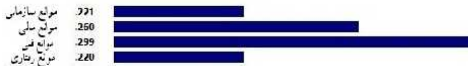
شکل ۲. وزن‌های معیارهای اصلی مربوط به موانع بلیت‌فروشی اینترنتی

یافته‌های نرم‌افزار که در شکل ۲ آمده است، حاکی از این است که عامل "فنی (T)"، عامل اصلی در موانع پیاده‌سازی بلیت‌فروشی اینترنتی است، و عوامل "مالی (F)"، "سازمانی (O)" و "رفتاری (B)" به ترتیب از دیگر اولویت‌های موانع پیاده‌سازی بلیت‌فروشی اینترنتی ذکر شده‌اند.