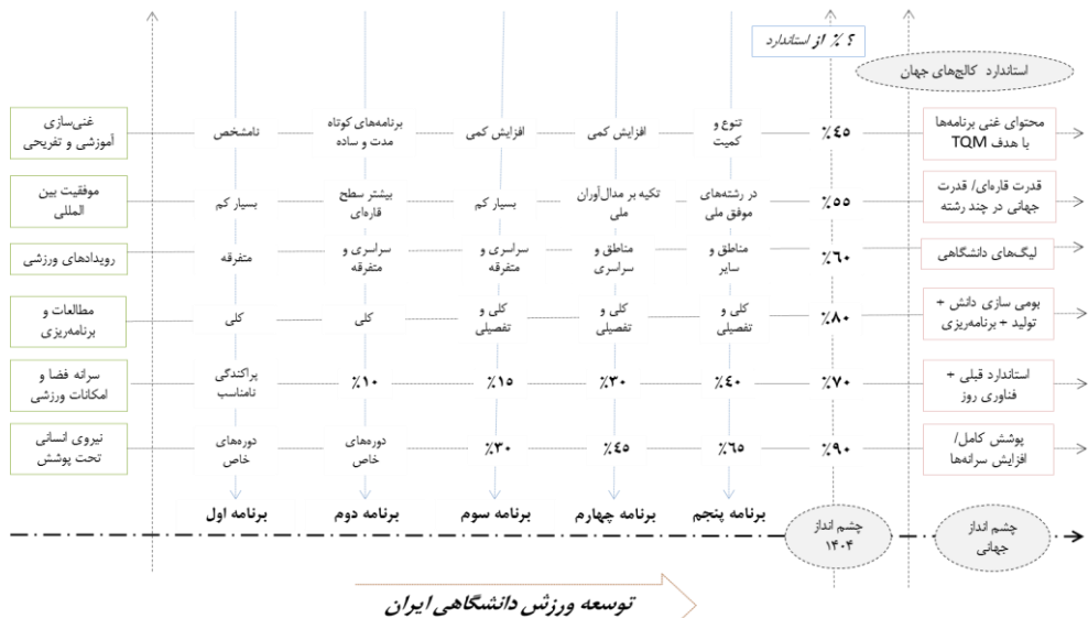
شکل ۳. مقایسه شاخص‌های بین‌المللی در توسعه ورزش دانشگاهی ایران براساس برنامه‌های کلان توسعه کشور

شاخص‌های بین‌المللی توسعه ورزش دانشگاهی از مطالعات راهبردی فدراسیون جهانی فیزو وبسایت این سازمان استخراج شده است و وضعیت آن‌ها در توسعه ورزش دانشگاهی کشور براساس اسناد و گزارش‌های اداره کل تربیت‌بدنی وزارت علوم مورد بررسی قرار گرفته است (شکل ۳). همچنین فراتر از چشم‌انداز ۱۴۰۴ توسعه کشور، استانداردها و چشم‌اندازهای جهانی متناسب با ورزش دانشگاهی کشور بسط داده شده است. براساس یافته‌های حاصل از بررسی